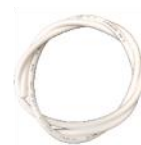
Tuyau de raccordement à connexion rapide