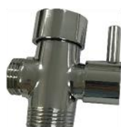
Robinet 3 Voies